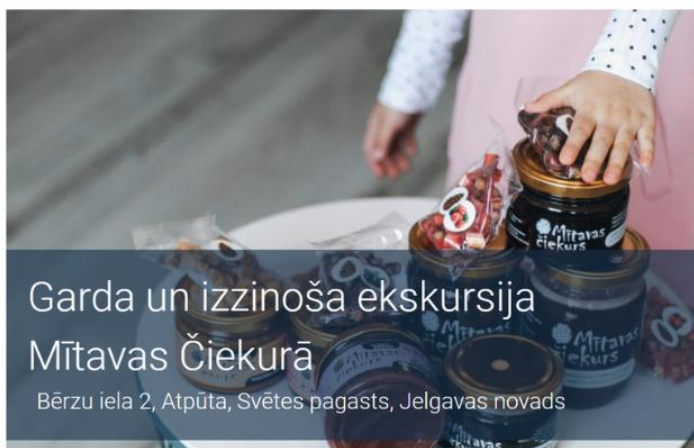
Garda un izzinoša ekskursija Mītavas Čiekurā

Laiks paskries nemanot, tāpēc jāreķinās ar vismaz 90 minūtēm!