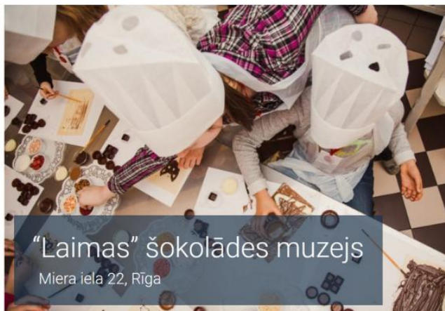
“Laimas” šokolādes muzejs